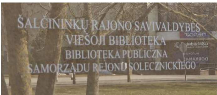
Užrašas ant pastato sienos

Biblioteka yra šiame pastate, antrame ir trečiame aukštuose.