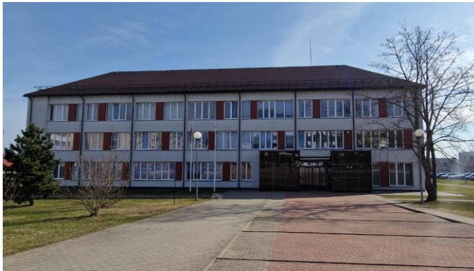
Bibliotekos vaizdas iš Vilniaus gatvės