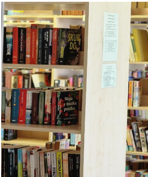
Bibliotekos lentynos su knygomis

Ant šio pastato sienos yra užrašas „Šalčininkų rajono savivaldybės viešoji biblioteka“.